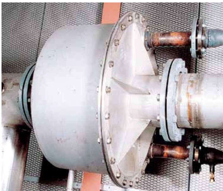
Värmeväxlare luft/vatten VLV installerad på Djupadal reningsverk i Sävsjö.