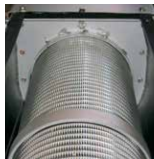
Läckeby Products skruvpress är utrustad med inspektionslucka över pressenheten och utbytbart pressrör.

Pressenheten är utrustad med en inspektionslucka för att underlätta underhållet och möjliggöra spolning av pressröret. Den flexibla infästningen av pressröret i pressenheten gör det enkelt att byta pressrör. Spiralen är försedd med borste över dräneringen för att minimera risken för igensättning. Som standard tillverkas skruvpressen i rostfritt material eller syrafast material med slitjärn av Hardox. Spiralen tillverkas som standard av svart material men kan även erbjudas i rostfritt stål.