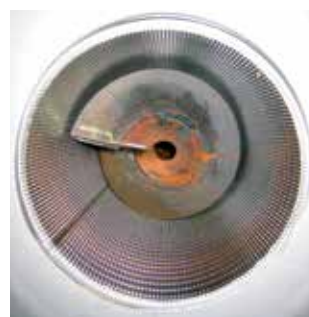
Invändig vy över pressrör i Wedge Weir och spiral i svart material S355J0.